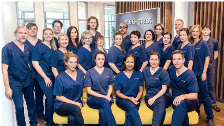
Una parte del equipo med-plast en Berlín: desde fisioterapeutas hasta nutricionistas y anestesistas especializados en lipedema.